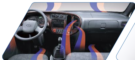
Amplio espacio interior